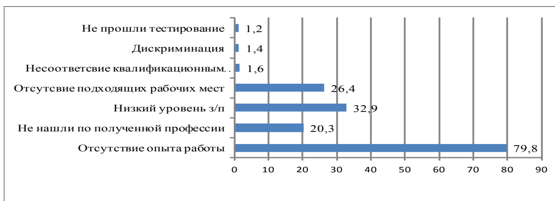
Рис. 1. Трудности при попытке устроиться на работу у выпускников 2010 – 2015 гг. выпуска образовательных организаций Хабаровского края (в % от числа опрошенных)

- низкий уровень оплаты труда молодых рабочих и специалистов и отсутствие у значительной части работодателей желания компенсировать его социальными гарантиями (обеспечением жильем, дошкольными учреждениями, стимулирующими выплатами за повышение квалификации, разрядности и др.) [5].